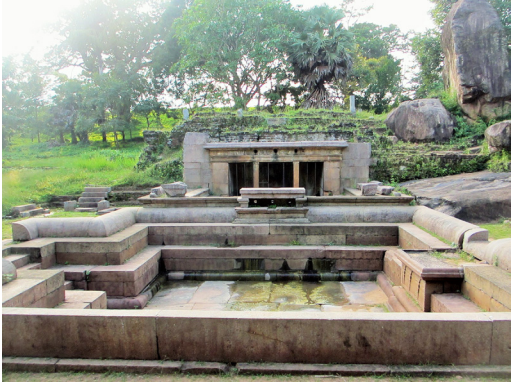
රන්මසු උයනේ පොකුණක්

වර්තමානයේ වෙස්සගිරිය ලෙසින් නාමීකරණය කර ඇති භූමියත් ඇතුළුව සමස්ත ඉසුරුමුණි විහාර සංකීර්ණය වෙත අවධානය යොමු කිරීමේ දී ඊට අයත් ප්‍රධාන විහාරාංග වන බෝධිඝරය වෙස්සගිරියේ ඊ ගල් රැන්දට බටහිර පසින් ද, උපෝසථඝරය ක ගල් රැන්දෙහි දකුණුපස කෙළවරේ ද, දානශාලාව ක ගල් රැන්දට නැගෙනහිරින් පිහිටි කුඹුරු මධ්‍යයේ ද, පැරණි ස්තූප ක ගල් රැන්ද මස්තකයේ සහ ඊට නැගෙනහිරින් පිහිටි පබ්බතාරාම කොටසේ ද, ප්‍රතිමා ගෘහ කිහිපයක් ද ඇතුළු ව හික්ෂු ආවාස හඳුනාගත හැකි අතර අනෙකුත් ආරාම සංකීර්ණයන්හි දක්නට ඇති අලංකාර පොකුණු මෙම විහාර සංකීර්ණයේ උතුරු කෙළවරෙහි ඇති රන්මසු උයනට ගොනුකර ඇති බව මෙම පර්යේෂණයෙන් තහවුරු කරගත හැකි විය. ඒ අනුව සමස්ත ආරාම භූමියෙහි ප්‍රයෝජනය පිණිස අලංකාර ලෙස සකස් නොකළ පොකුණු කිහිපයක් ම වගුරු සහ පතන වශයෙන් දැනට දකගත හැකි අතර අලංකාර ලෙස සකස්කළ පොකුණු පිහිටුවා ඇත්තේ පහසුවෙන් ම ජලය සම්පාදනය කළ හැකි රන්මසු උයන භූමියෙහි ය. සිව්වැනි මිහිදු රජුගේ සෙල්ලිපියෙහි සඳහන් පරිද්දෙන් ම රන්මසු උයන ප්‍රමුඛ කොටගත් ඉසුරුමුණි විහාරයට අයත් පොකුණු වෙත ජලය සම්පාදනය කිරීම තිසාවැවේ මොහොල්නග සොරොව්ව හාර නිලධාරියාගේ ප්‍රධානතම කර්තව්‍ය වන්නට ඇති බවට නිගමනය කළ හැකි හෙයින් මෙය හුදෙක් රාජකීය මගුල් උයන නොව ඉසුරුමුණි විහාරවාසී භික්ෂූන්ගේ ප්‍රයෝජනය පිණිස නිර්මාණය කළ පොකුණු පද්ධතියක් බව තහවුරු කළ හැකි වේ.